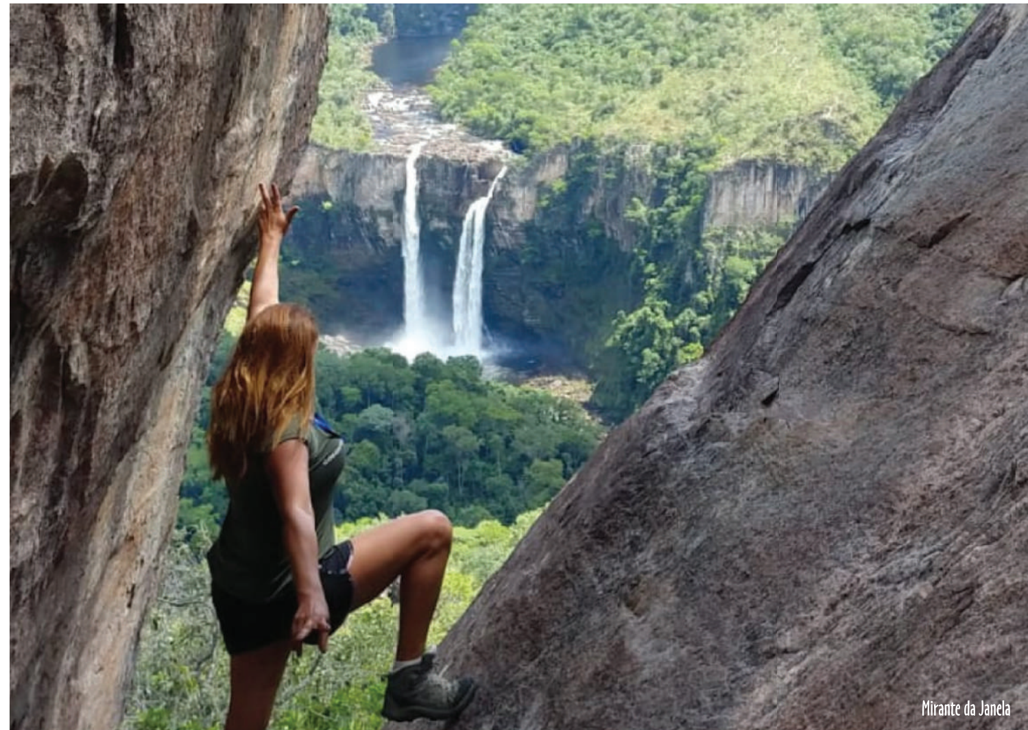
Mirante da Janela

A Chapada dos Veadeiros está no maior planalto do centro do Brasil, uma formação rochosa entre as mais antigas superfícies do planeta, com cerca de 1,8 bilhões anos