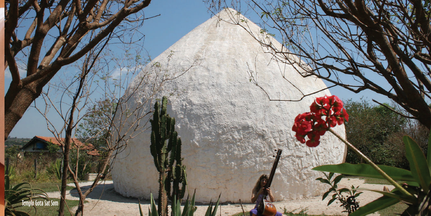
Templo Gota Sat Som