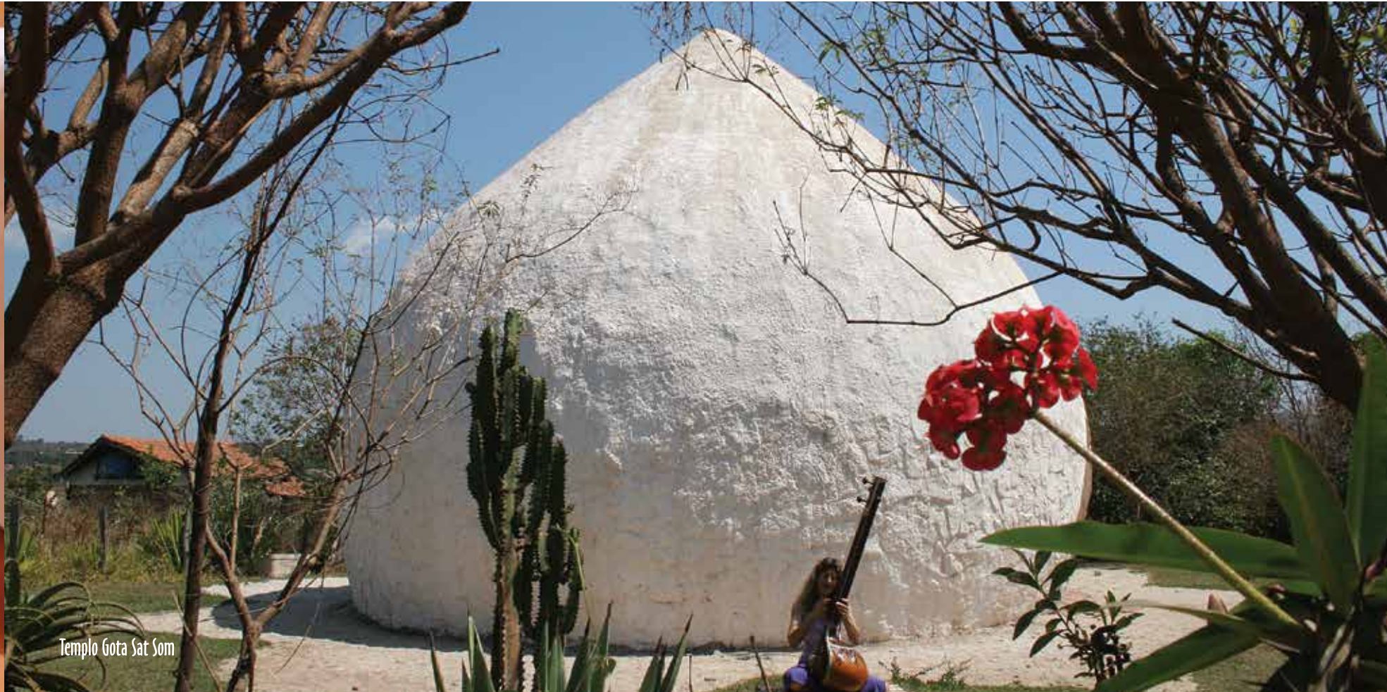
Templo Gota Sat Som